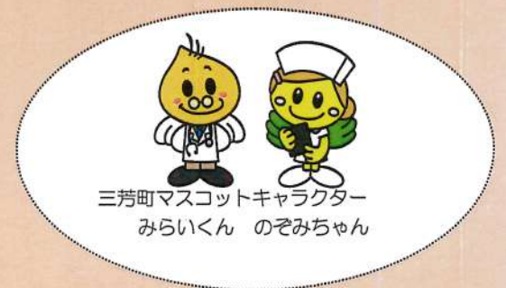
三芳町マスコットキャラクター みらいくん のぞみちゃん