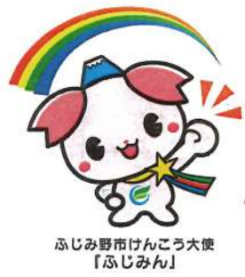
ふじみ野市けんこう大使 「ふじみん」