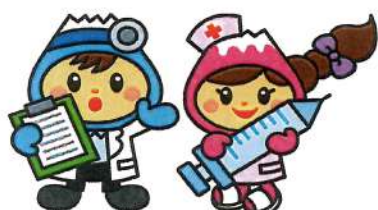
富士見市マスコットキャラクター 「ふわっぴー」

☎049-252-3771 ☎049-262-9040 ☎049-258-0019 (内線 188～190)