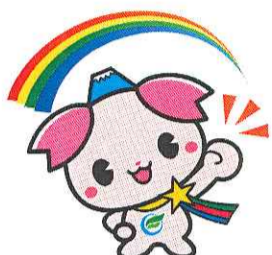
ふじみ野市けんこう大使「ふじみん」