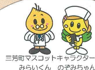
三芳町マスコットキャラクター みらいくん のぞみちゃん