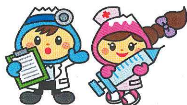
富士見市マスコットキャラクター 「ふわっぴー」

☎049-252-3771 ☎049-262-9040 ☎049-258-0019 (内線 188～191)