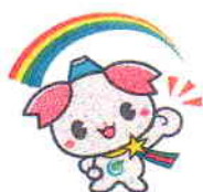
ふじみ野市けんこう大使「ふじみん」