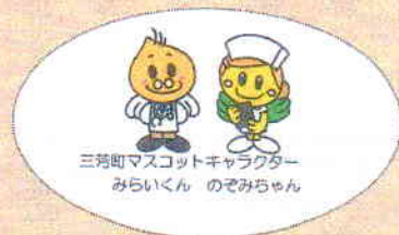
三芳町マスコットキャラクター みらいくん のみちちゃん