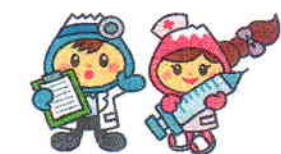
富士見市マスコットキャラクター 「ふわっぴー」

☎049-252-3771 ☎049-262-9040 ☎049-258-0019 (内線 188~191)